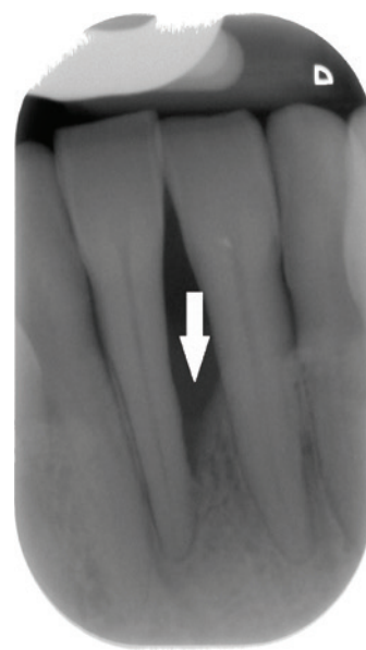
Difetto osseo verticale