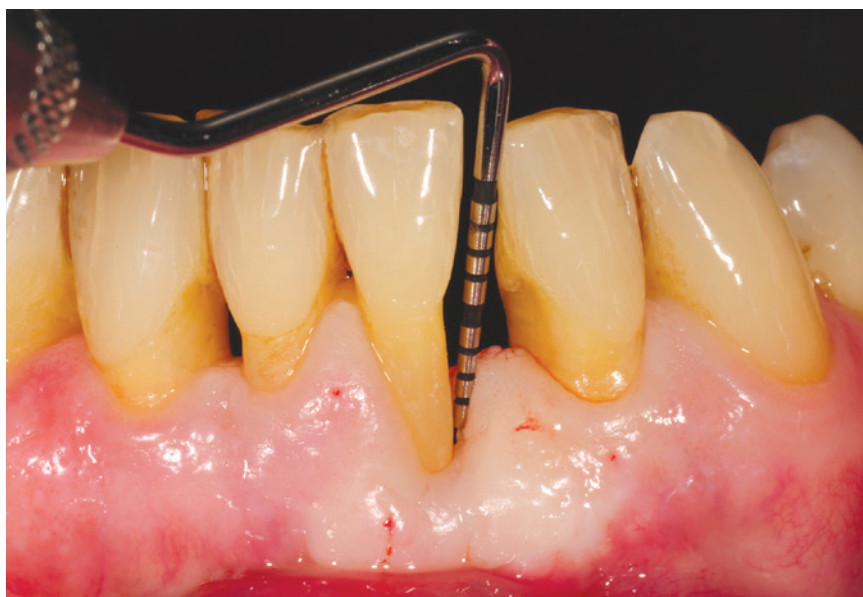
Tasca parodontale evidenziata dall'utilizzo della sonda parodontale

Esistono delle linee guida cioè dei consigli pratici decisi dagli esperti che tutti dovrebbero conoscere; questo vale per la bocca ma dovrebbe essere applicato a tutte discipline mediche in modo tale da riuscire a prevenire la malattia: il concetto è semplice e anche un proverbio ci ricorda quale dovrebbe essere il comportamento migliore da adottare: "prevenire è meglio che curare"