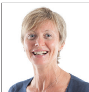
a cura di: Dr.ssa Silvia Masiero Parodontologa

H o un dente che si muove, mi sanguinano le gengive, a volte mi sembra di avere l'alito cattivo... quanti di noi a volte pensano e ripensano a queste situazioni e continuano a farlo troppo a lungo decidendo solo tardivamente di andare a fare una visita di controllo dal proprio dentista?