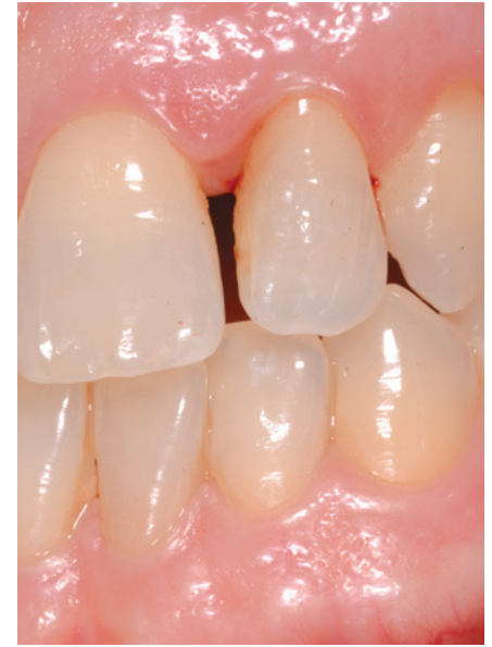
Tasca parodontale su incisivo laterale superiore evidenziata dall'utilizzo della sonda parodontale